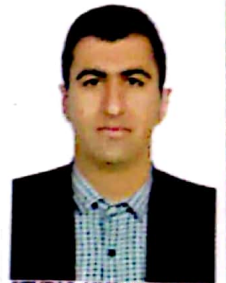
STUDIO AKSBARAN 73173